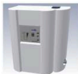
Gestionnaire d'eau (en option)

Il gère automatiquement l'appoint d'eau en cas de citerne vide. Silencieux, il ne consomme que très peu d'énergie.