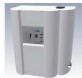
Gestionnaire d'eau (en option)

Il gère automatiquement l'appoint d'eau en cas de citerne vide. Silencieux, il ne consomme que très peu d'énergie.